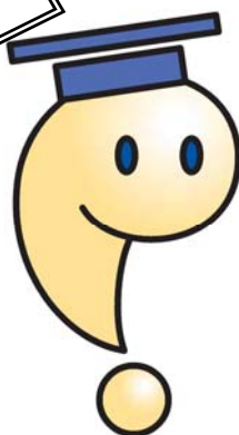
日本弁理士会キャラクター はっぴょん

日本知的財産仲裁センターは知財紛争の未然防止及び解決に役立つ業務を行っています。先ずはご相談ください。